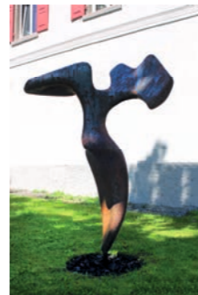
Phönix Oliver Ritter 15 2015 Salem-Mittelstenweiler www.o-ritter.de

Sie tanzen, sie bewegen sich in Luft und Blau und Grün hinein, einen Moment innehaltend, langbeinige Wesen des Übergangs, zu Form geronnene Gedanken aus dem Unterbewusstsein, wie fliegende Fische auf einem weiten Ozean der Geschichte. Baustahl, Stoff und Farbe