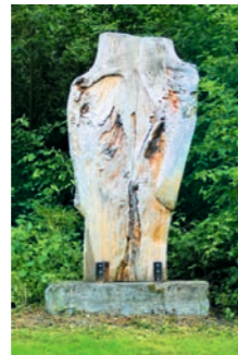
Der kopflose Engel Uwe Petrowitz 5 2012 Friedrichshafen www.kg-see.de

Die makroskopische Naturdarstellung mit weicher Linienggebung in Verbindung mit hartem Stahl erzeugt eine veränderte Wirkung und eine neue Sehweise. Stahl farbig lackiert