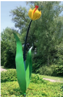
Tulpe Andreas Eltrich 1 2009 Tettngang-Wiedenbach www.steel4art.de

Die makroskopische Naturdarstellung mit weicher Linienggebung in Verbindung mit hartem Stahl erzeugt eine veränderte Wirkung und eine neue Sehweise. Stahl farbig lackiert