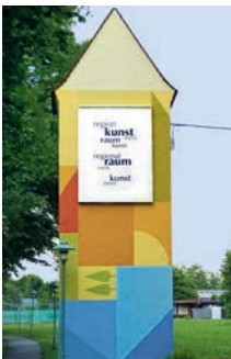
KunstRaumTurm Team KunstRaum Oberteuringen 2 2012 www.muehle-ot.de > KunstRaum Sponsor · Regionalwerk Bodensee

Elemente der einfachen Stammeskunst aus Afrika und Ozeanien zeigen sich in der Überproportionierung einzelner Körperteile. Die geraden Sägeschnitte verleihen den organischen Formen des menschlichen Körpers harte Kanten und technische Linien. Eiche natur, Eiche schwarzweiß gefasst