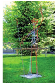
Krates von Theben Brigitte-Jutta Schaidler 14 2015 Kressbronn-Gießeln www.indo-arts.de

»Mother Earth« ist Sinnbild einer Ur-Erde, menschenähnlich anmutend, das Tun ihrer Kinder skeptisch beobachtend. Eiche und Findling