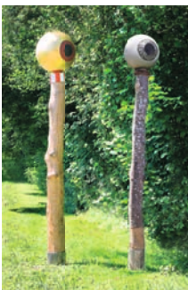
Brückenwächter Golden Eye & Silberblick Dr. Dietmar Hawran 4 2015 Ravensburg

Der Sage nach baut sich der Vogel ein Nest aus Asche und Weihrauch, wenn er alt ist, und zündet es an und verbrennt sich selbst, um dann verjüngt in neuer Schönheit aufzusteigen. Stahlbleche kalt geformt und geschweißt