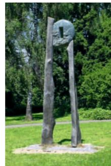
Durchglück Falko Jahn 6 2013 Wangen-Käferhofen www.falko-jahn.de

Strom-Umspannstation »6023 Rotach« Ausgerichtet auf die vier Himmelsrichtungen, zeigt die grafische Farbgestaltung mit einzelnen Symbolen die vier Jahreszeiten. Der Turm betont den Raum für die Kunst an der Rotach.