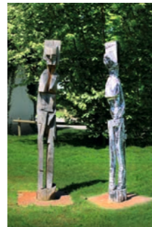
Zwei Schwestern Franz Kussauer 13 2015 Kißlegg www.kussauer-maga.de

Was ist das hier? Brachte die Eiszeit oder eine Flut das Relikt vergangener Jahrhunderte an die Ufer der Rotach? Steig ein und begeben dich auf eine fantasievolle imaginäre Reise... Baustahl vom Schrottplatz