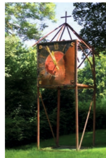
Glockenturm Keine Gnade Markus Meyer 7 2015 Ravensburg www.markus-meyer.eu

Beide Kreisel-Objekte stehen frei auf einer Achse und können in Drehbewegungen versetzt werden, die dann in ein Taumeln übergehen. Stahl unbehandelt & rostend