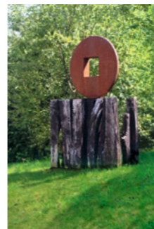
Human Fingerprint Within The Universe Samy R. R. Vermeulen 16 2012 Oberbrombach www.samydesign.de

Sponsor · 1a autoservice Hillebrand Unterteuringen Ausgemusterte Bremscheiben und Autoreifen verbinden sich zum Objekt mit Klangspiel – die gesprengt liegende Acht symbolisiert die Endlichkeit der Ressourcen und des Wirtschaftswachstums. Metall und Autoreifen