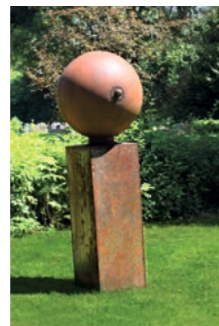
Mutter Erde Dr. Dietmar Hawran 8 2015 Ravensburg

Zwei als Augen stilisierte Wächter am ehemaligen Grenzfluss Rotach präsentieren mit ihren Farben ihre Macht und ihre Herrschaftsgebiete. Buchenstämme, verzinktes Metall vergoldet / versilbert