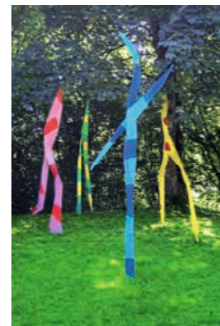
Wiesenballett Michael Kussl 11 2012 Owingen www.klangundeisen.de

Der Glockenturm trägt ein Zifferblatt, bei dem der Zeiger kurz vor zwölf stehen blieb, aber es fehlt die Glocke, die früher zur Begnadigung geläutet wurde. Metallkonstruktion & Ziffernblatt einer Kirchturmuhre