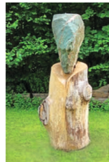
Mother Earth Lutz Gruna 10 2013 Markdorf-Wirrensegl www.a33-skulpturen.de

Die Skulptur »Durchglück« symbolisiert ein Tor – die Türen, die man im Leben auf- und zuschlägt. Sie ist eine Aufforderung hindurch zu schreiten und sein Glück zu versuchen. Eiche und Serpentin