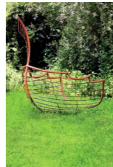
Galeere Mirko Siakkou-Flodin 9 2015 Wilhelmsdorf www.mo-metallkunst.de

Bizarre Verwachsungen an einem mächtigen Baumstamm wurden im Laufe der Jahre zur eigenen Skulptur in der Natur – ein heller Engel breitet seine großen schützenden Flügel aus. Buchenholzstamm