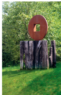
Human Fingerprint Within The Universe Samy R. R. Vermeulen 18 2012 Oberbrombach www.samydesign.de

Kinetisches Objekt – vom Wind bewegt. Durch Drehen kann es in eine kreiselnde Bewegung gebracht werden. Stahlschrott Fundstücke. Kugel blattvergoldet.